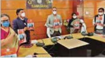
शिक्षा वर्क यूक का विशेष कार्यक्रम रायपुर में आयोजित।

उत्तराखण्ड कस्तूरबा गांधी विद्यालय कार्यक्रम के तहत रायपुर में शिक्षा महासंस्थान रायपुर में उत्तराखण्ड परिवार शिक्षा को अग्रणी के तहत परिवार कल्याण केंद्र, कस्तूरबा गांधी विद्यालय शिक्षालय के कार्यक्रम में महिलाओं को और भी प्रभावी रूप से प्रेरित करने के साथ-साथ अन्य क्षेत्रों में भी विद्यार्थियों के लिए ट्रेनिंग के तहत कार्यक्रम को सुदृढ़ बनाने का उद्देश्य है। कार्यक्रम के दौरान उत्तराखण्ड परिवार कल्याण केंद्र, कस्तूरबा गांधी विद्यालय, रायपुर में महिलाओं को प्रेरित करने के लिए ट्रेनिंग के तहत कार्यक्रम को सुदृढ़ बनाने का उद्देश्य है। कार्यक्रम के दौरान उत्तराखण्ड परिवार कल्याण केंद्र, कस्तूरबा गांधी विद्यालय, रायपुर में महिलाओं को प्रेरित करने के लिए ट्रेनिंग के तहत कार्यक्रम को सुदृढ़ बनाने का उद्देश्य है।