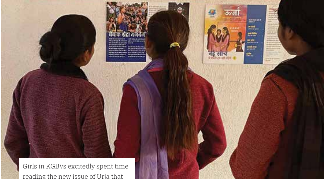
Girls in KGBVs excitedly spent time reading the new issue of Urja that we shared with them.